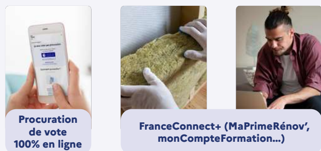
Procuration de vote 100% en ligne

Chaque citoyen qui utilise France Identité peut faire certifier son identité numérique en mairie. Une identité numérique certifiée permet de réaliser les démarches les plus sensibles :